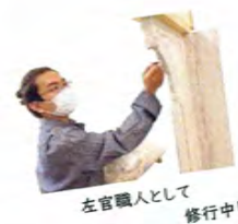
左官職人として 修行中!