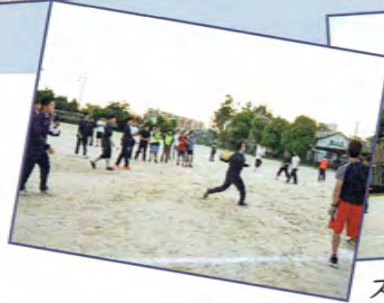
スポーツテスト 球技大会