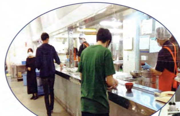
手洗い消毒を行い自分で配膳します

主食(米飯・パン・麺)、副食、牛乳などによる完全給食です。栄養士さんが考えた栄養満点のメニューを、毎日調理員さん達が作ってくれます。出来立ての温かい給食は、学校生活の楽しみの1つです。