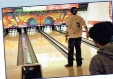
卒業生を送る会(ボウリング大会)