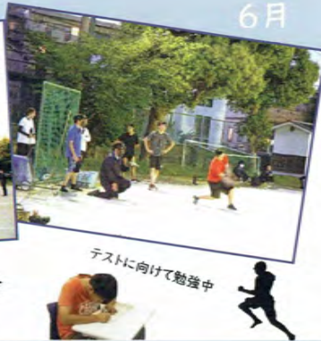
テストに向けて勉強中