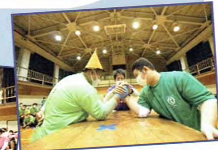
※学校行事は年度によって変更があります