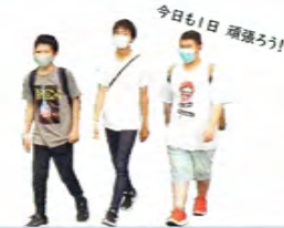
遠足(長島)・野球観戦