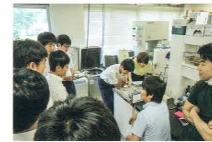
信州大学 / 農学部