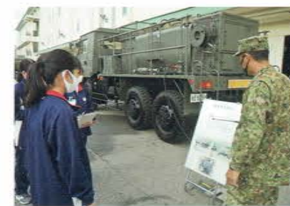
自衛隊守山駐屯地