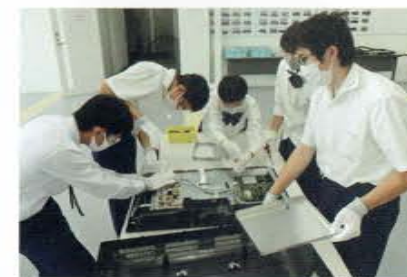
グリーンサイクル株式会社

※他に、ワタキューセイモア株式会社名古屋支店、七福醸造株式会社、矢作建設工業株式会社、おいでん・さんそんセンター、豊川信用金庫などを見学