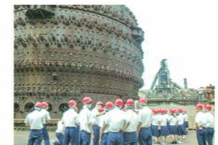
日本製鉄株式会社