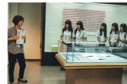
滋賀大学 / 経済学部

※他に、静岡大学 教育学部、滋賀県立大学 人間文化学部、静岡国立大学 看護・薬学部、岐阜大学 工学部、静岡大学 理学部、滋賀県立大学 工学部、信州大学 農学部などの大学を見学