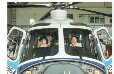
中部空港海上保安航空基地