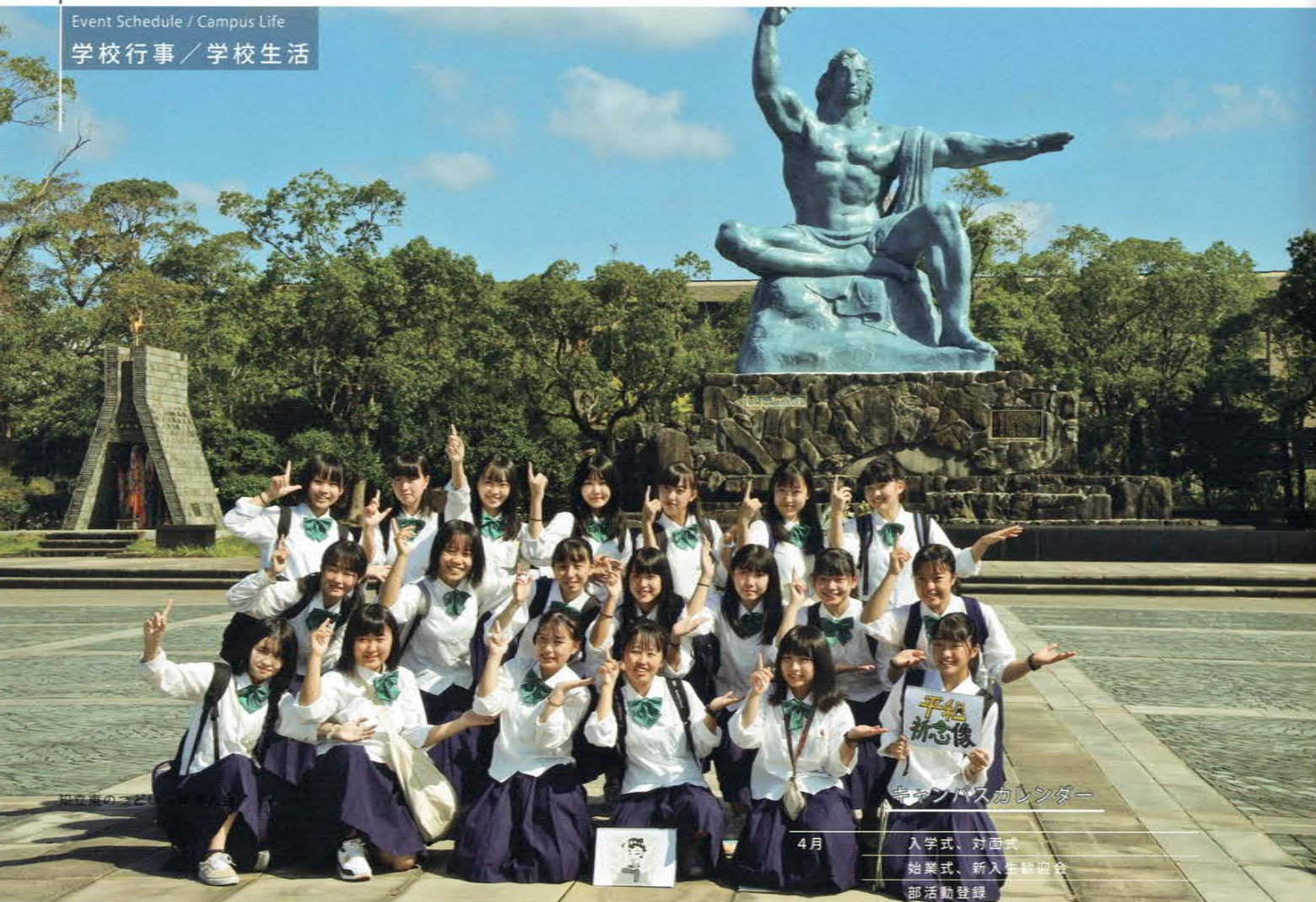
キャンパスカレンダー