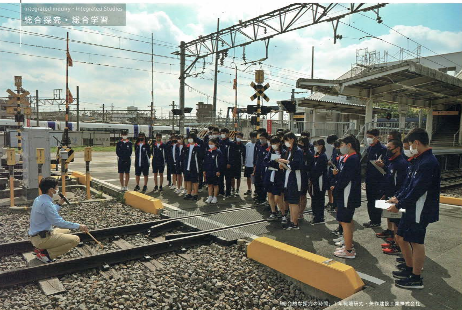
「総合的な探究の時間」1年職場研究・矢作建設工業株式会社