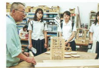
静岡文化芸術大学 / 文化政策学部