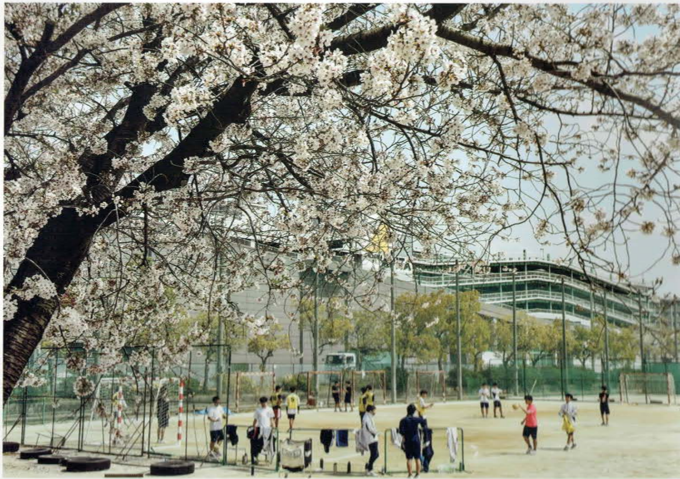
AICHI PR. CHIRYU HIGASHI SENIOR HIGH SCHOOL SCHOOL GUIDE 2021