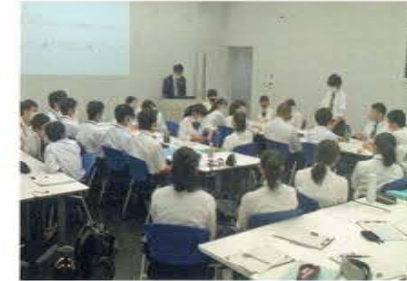
東海旅客鉄道株式会社 リニア・鉄道館