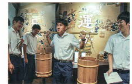
ミツカンミュージアム

※他に中部航空地方気象台・中部国際空港 JAL お仕事講座・中部空港税関支署・中部電力川越火力発電所・コカ・コーラボラーターズジャパン東海工場・岐阜かかみがはら航空宇宙博物館・岐阜県先端科学技術体験センター・浜松ホトニクス浜松中央研究所・ヤマハ発動機株式会社・東亜合成株式会社名古屋工場などを見学