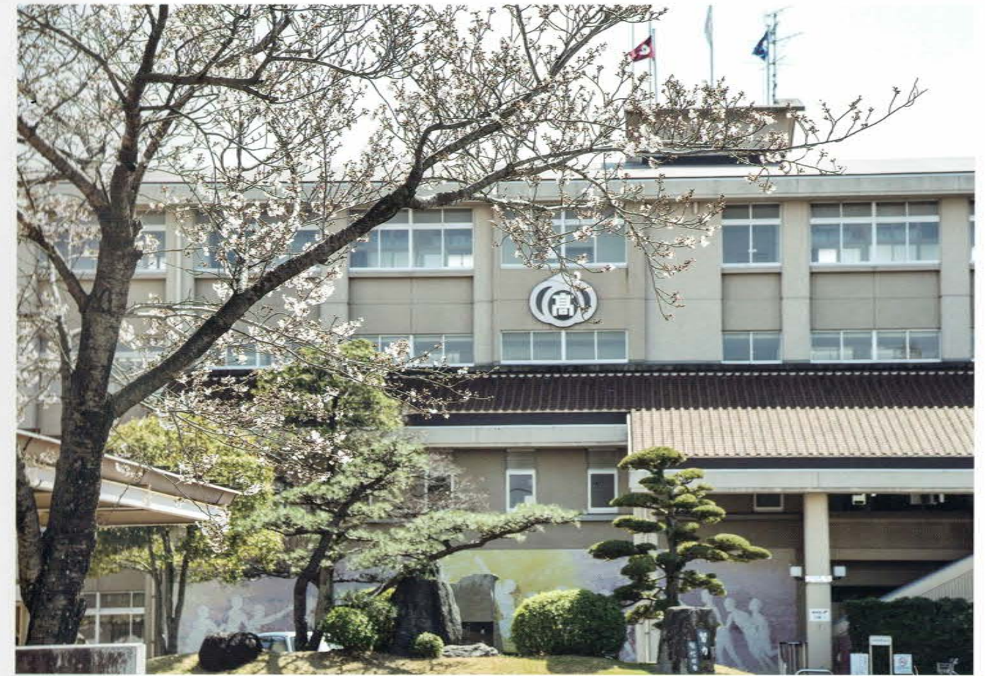
AICHI PR. CHIRYU HIGASHI SENIOR HIGH SCHOOL SCHOOL GUIDE 2021