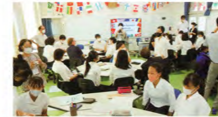
マルチメディア教室