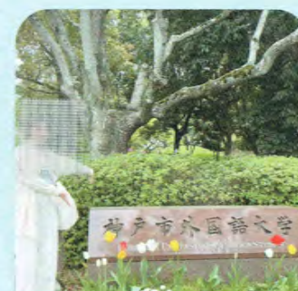
神戸市外国語大学 外国語学部

受験勉強は本当に苦しいですが、ぜひ皆さんもモチベーションを見つけて毎日コツコツ勉強し、自分の夢を掴み取ってください。