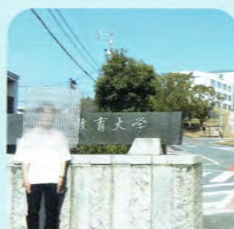
愛知教育大学 義務教育専攻 算数・数学専修