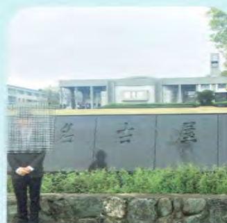
名古屋大学・経済学部