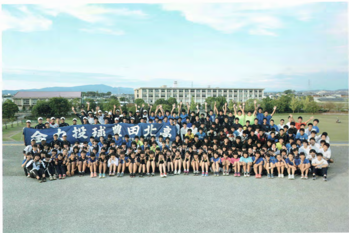
TOYOTA KITA SENIOR HIGH SCHOOL