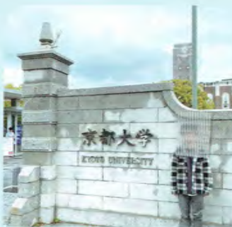
京都大学・工学部