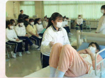
介護実習報告会（介護技術発表）