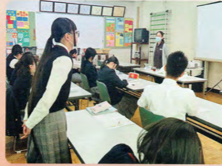
実習施設指導者による事前指導