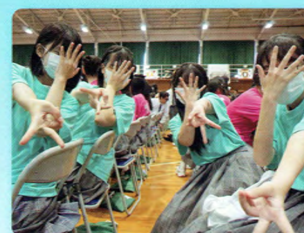
たかこう祭 (文化祭)