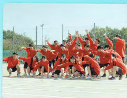
たかこう祭 (体育大会)