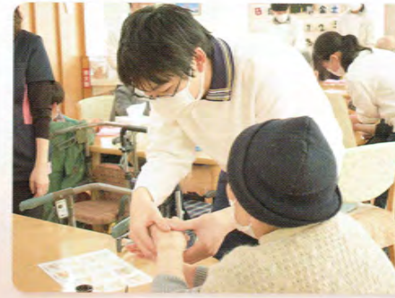
まごのてキャラバン（ハンドケア）