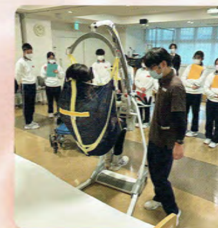
施設での介護機器体験授業