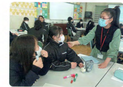
外国人介護職との交流