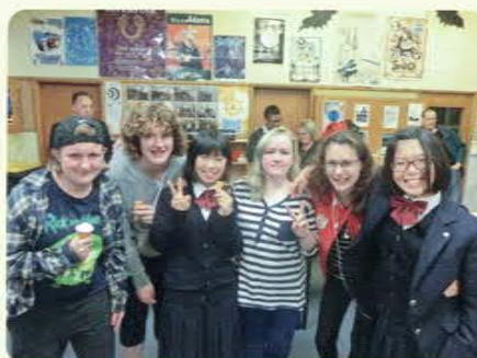
フェアウェルパーティにて