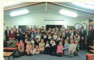
ホストスチューデントと