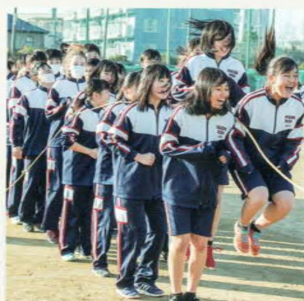
みんなでジャンプ大会