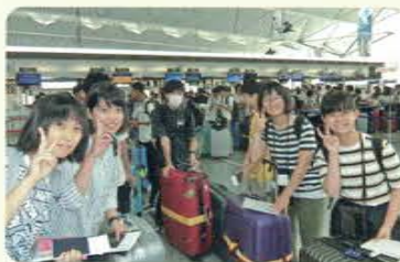
行ってきます♡ (セントシア中部国際空港)