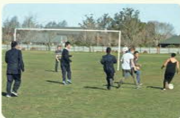
サッカーで、国際交流