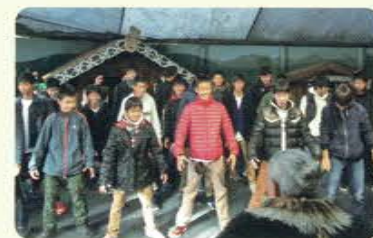
ウィロウバンク動物公園での マオリショー