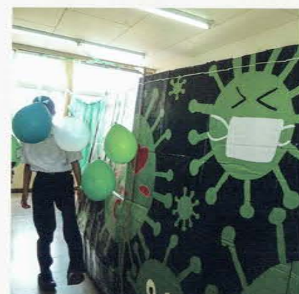
西高祭 (文化の集い)