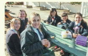
一緒にランチしました。