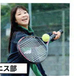
ソフトテニス同好会