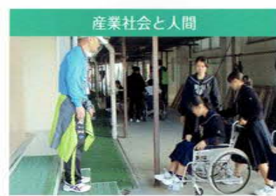
産業社会と人間 福祉実践教室で車イスを体験しました