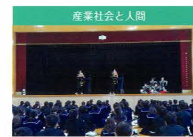
産業社会と人間 知立の伝統芸能である山車文楽を鑑賞しました