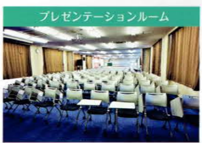
プレゼンテーションルーム 一学年(240名)全員が入れる大型教室です