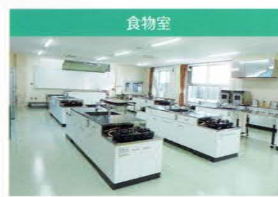
食物室 バリアフリー化を施した実習室です