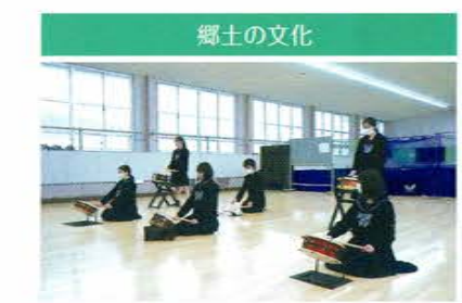
郷土の文化 太鼓の演奏を体験しました