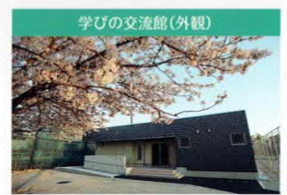
学びの交流館(外観) 新しく完成した「学びの交流館」です地域との交流の場としても利用します