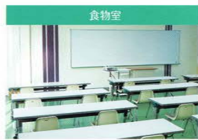
食物室 多目的に活用できるスペースがあります