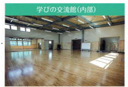
学びの交流館(内部) 全面フローリング、バリアフリー化されています