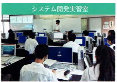
システム開発実習室 コンピュータを活用し充実した学習ができます