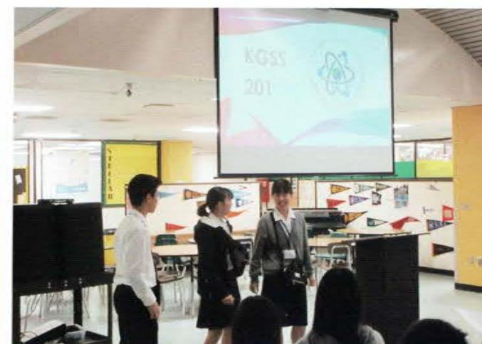
海外研修プレゼンテーション