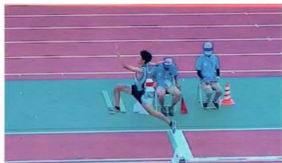
令和4年度全国高等学校総合体育大会 男子三段跳び出場