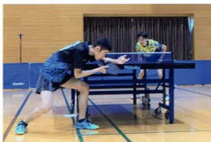
第50回記念全国高等学校選抜卓球大会 男子シングルス 出場