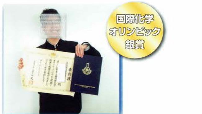
国際化学 オリンピック 銀賞

3年生普通科は文系、理系のコースに分かれ、進路希望に応じた幅広い知識と能力を身につけ、将来にじっくり目を向けるという基本方針のもと日々の学習に取り組んでいます。時代の変化に即応しつつも、人間形成に必要な確固たるものは残していくのが、本校の教育に取り組む姿勢です。