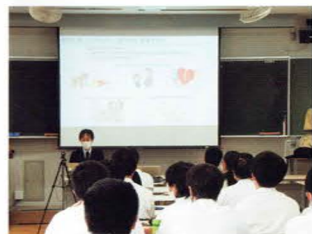
大学の先生による出張授業