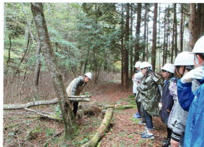
グローバルサイエンスキャンプ フィールドワーク

グローバル教育としては、理数専任外国人講師が科学の内容について英語で授業（『SS科学英語』）を行っています。また、海外研修では現地の学生と研究交流し、英語で意見交換を行います。さらに、大学や研究施設を視察することにより、世界的な科学技術の最先端について見聞を広めます。