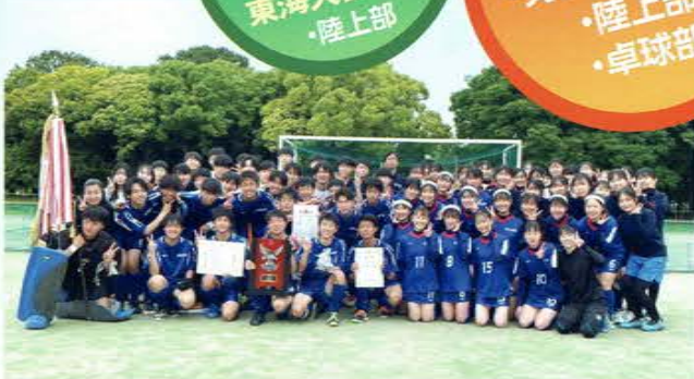
令和4年度全国高等学校ホッケー選手権大会 男女ベスト16