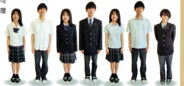
女子夏服 男子夏服 女子冬服 男子冬服 女子 Polo 男子 Polo 女子制服 スラックス