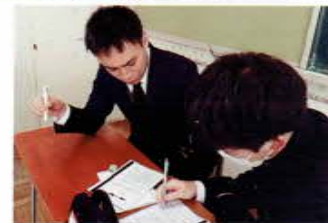
一人ひとりに面談し、一緒に進路を考えてくれる先生たち