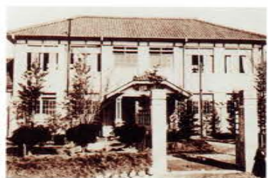
愛知県丹羽郡高等女学校