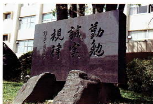
尾北の本館前庭にある校訓碑

自由で伸び伸びとした尾北高校の校風。その根幹をなすものが、この校訓です。生徒一人ひとりに宿る、自分の目標に向かって勉強を頑張ろうとする「勤勉」さ、他者に対して「誠実」であろうとする姿勢と「規律」を重んじる心が、現在の明るく穏やかな尾北高校を作っているのです。