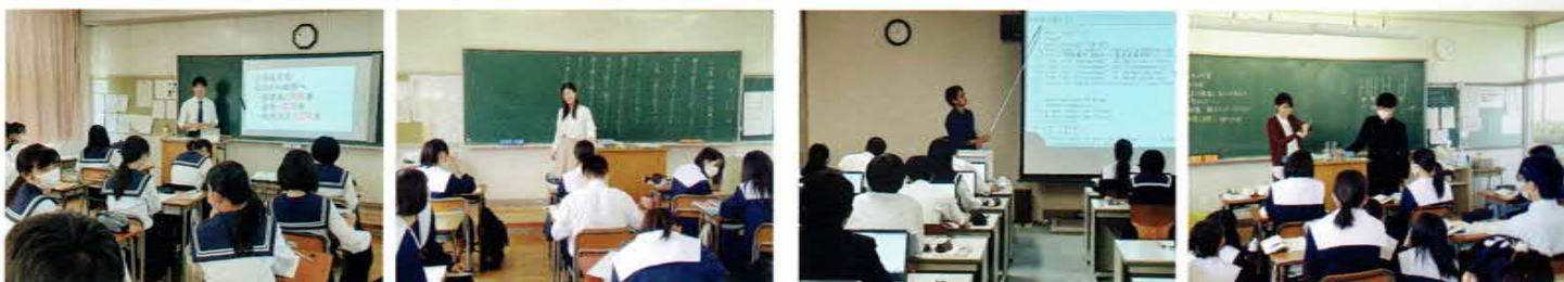
パソコンのプレゼンテーションソフトを使って日本史の講義中 古文のなかの体言と用言を考えている生徒たち パソコンルームでHTML言語を学習中 酵素の反応を見る実験中。リアルな体験が本物の知識に

文系 教えこむ授業ではなく、生徒が考える授業を展開 理系 日常生活に使える、生きた理系教育を実現