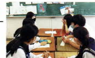
先進的な英語教育を推進

ネイティブの講師陣の授業が受けられるうえ、留学生を常に受け入れているため、生きた国際交流を日常的に体験できます。