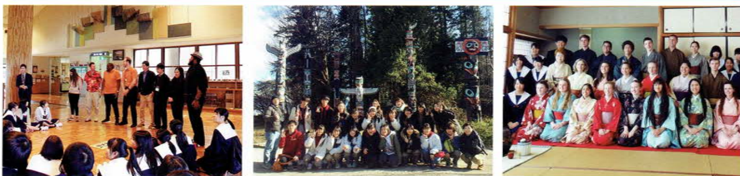
イングリッシュキャンプでは3日間英語づけ