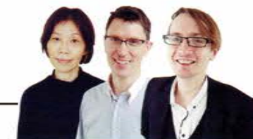
私たちが教えます!

2泊3日のイングリッシュキャンプ、中学校への出前授業、JICA訪問、留学生との交流など、独自の行事が盛りだくさん!