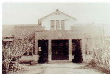
古知野町立古知野高等実践女学校