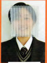
(みよし市立北中出身)

私は、国公立大学に進学し、外国語学部で学ぶことを目標としています。共通テストを受けるために必要な知識に加え、自分の選択肢を広げるために倫理も学びたいと思い、「文プラン」を選びました。実際私は2年生の後半になるまで、現在と異なる大学・学部を目指していましたが、偏りの少ない教科選択をしていたので、進路の方針