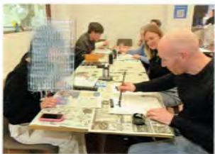
ダービーシャー高校生派遣