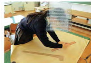
ファッション造形

いく実感があって楽しいです。また、大変な部分もありますが作品が完成した時の達成感は大きく次のモチベーションにも繋がります。ファッションが好きな方、興味のある方はぜひ服飾プランで学んでみてください。