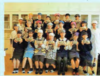
メグリアとのコラボ

もできました。このような学びを通して2年間で多くの知識や技術を身に付けることができます。皆さんも豊田東高校で「夢の実現」を目指してみませんか。