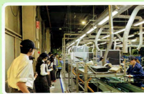
企業・キャンパス見学会