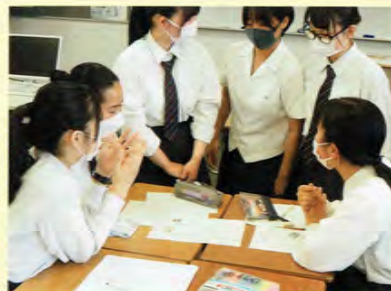
ディスカッション