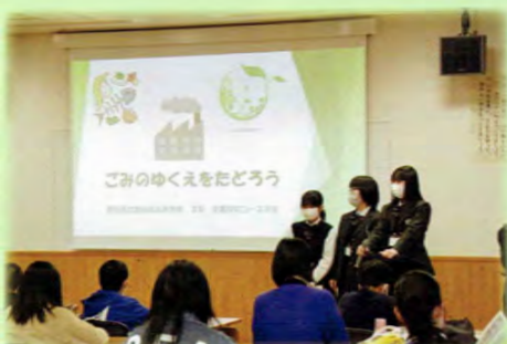
豊田市環境学習施設エコットと連携した市民講座の企画・運営など、環境を学ぶ活動を行っています。