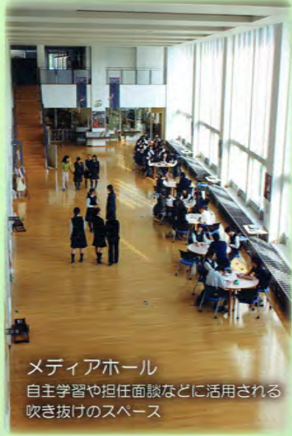
メディアホール 自主学習や担任面談などに活用される 吹き抜けのスペース

本校は、昨年度（令和5年度）創立100周年を迎えた伝統校です。1924年（大正13年）創立の学母高等女学校を前身とし、公立普通科の女子校として長く歩んできましたが、平成19年に七州台から矢作川河畔の新校地へ移転し、同時に男女共学・総合学科の高校となって新たな歴史をスタートさせました。同窓会「わかきぬ会」の会員は2万4千人を超え、地域の各分野で活躍しています。