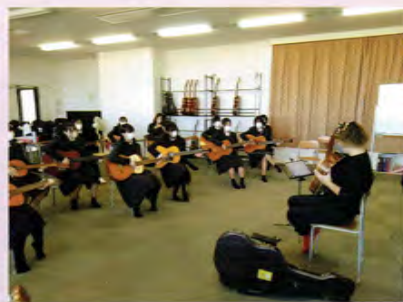
プランの日(ギター講座)