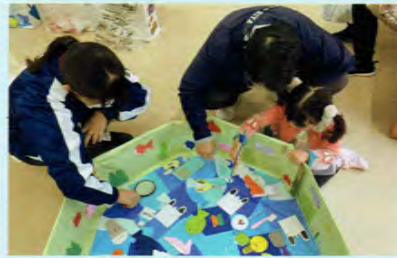
美里交流館での活動

遊びを考えて年齢に合わせたルール設定をしたり、制作を行ったりします。ボランティア活動も多く、子どもと関わる機会がたくさんあります。皆さんも東高で同じ夢をもつ仲間と共に夢を実現しませんか。