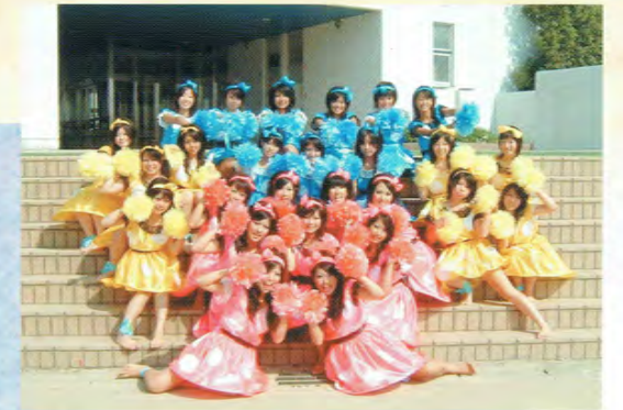
体育祭 ブロックアピール