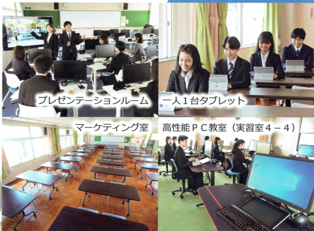
プレゼンテーションルーム