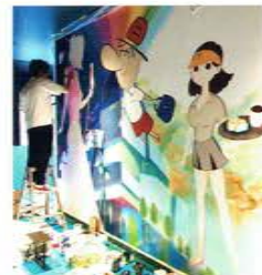
渋谷パルコの地下に壁画を描き中