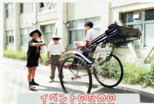
イベントのための人物等の練習風景