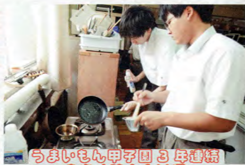
うまいもん甲子園3年連続東海北陸大会出場