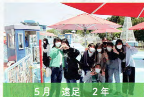
5月 遠足 2年