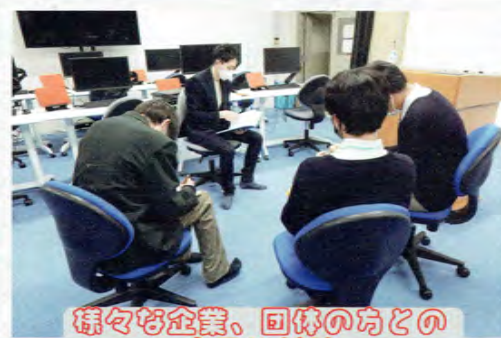
様々な企業、団体の方との企画や対談