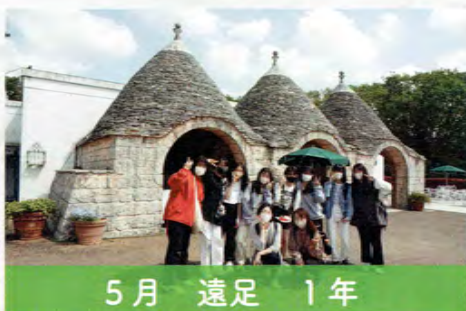
5月 遠足 1年