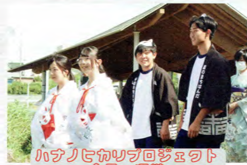
ハナノヒカリプロジェクト企画・運営