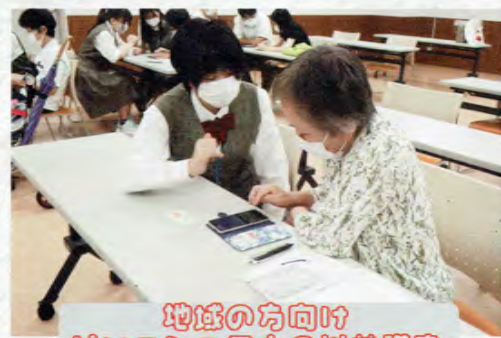
地域の方向けパソコンマホの出前講座