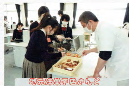
地元洋菓子店さんとコラボ商品開発