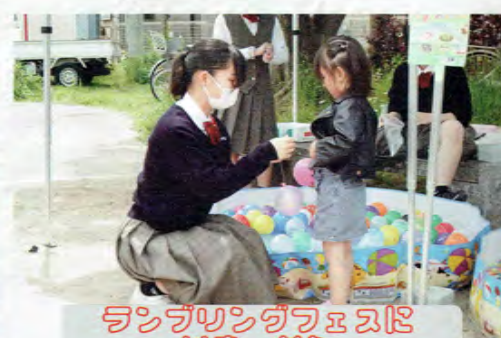
ランタリングフェスティバルに出店・参加