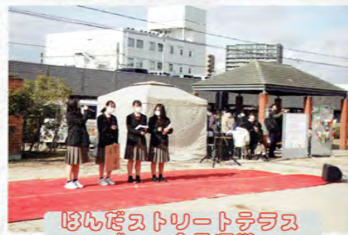
ほんだストリートテラスブース企画運営