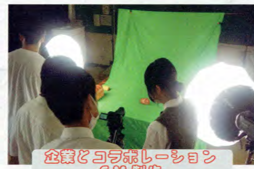
企業とコラボレーションCM制作