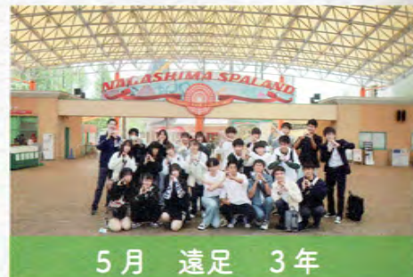
5月 遠足 3年