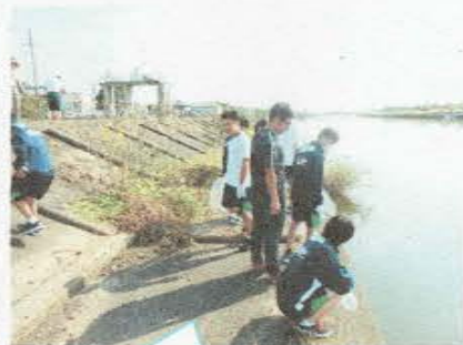
校外実習（環境防災コース）

また、少人数指導やTTでの授業を行い、勉強が得意な生徒も苦手な生徒も満足できるような教育を提供しています。