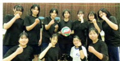
バレーボール女子

技術面だけでなく、人としても成長できる部活です。初心者が多いですが、県大会出場を目指し、切磋琢磨しながら日々練習を積み重ねています。