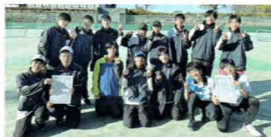
ソフトテニス男子

団体・個人ともに県大会出場、さらに県で勝つことを目標に日々努力しています。さらに、ソフトテニスを通して「自ら考え、行動できる人間」へ成長することも目標です。最高成績は、個人：県5位（東海出場）、団体：県5位（県選抜出場）です！名北地区でソフトテニスやるなら、高蔵寺高校だ！詳しくは本校HPをご覧ください。