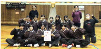
バスケットボール女子

県大会出場に向けて、練習を頑張っています。楽しく活動できる部であると自負しています。興味のある方は是非いっしょに頑張らしましょう。