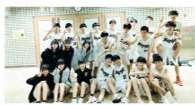
バスケットボール男子

初心者が多いチームですが、勝利を目指して日々練習に励んでいます。目標は県大会出場！目的は人間的成長！