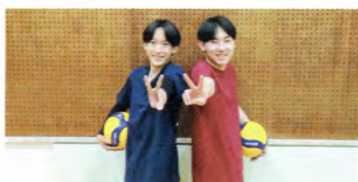
バレーボール男子

県大会を目指して日々頑張っています。先輩後輩関係なくチームワークとコミュニケーションを大切に絶対目標達成します！