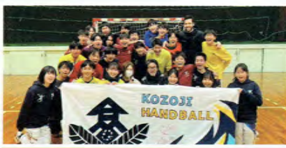
ハンドボール男子

団体・個人ともに県大会出場、さらに県で勝つことを目標に日々努力しています。さらに、ソフトテニスを通して「自ら考え、行動できる人間」へ成長することも目標です。最高成績は、個人：県5位（東海出場）、団体：県5位（県選抜出場）です！名北地区でソフトテニスやるなら、高蔵寺高校だ！詳しくは本校HPをご覧ください。