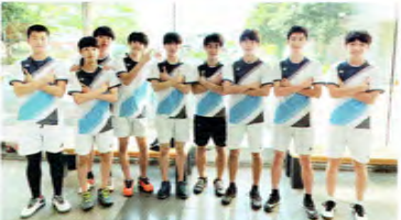
バドミントン男子

県大会ベスト8を目標に、日々の練習を積み重ねています。ラグビーだけでなく、あいさつや勉強にも力を入れているので、人としても成長していける部活です。また、選手のほとんどが未経験者です。一緒にラグビーをやりたい。