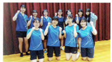
バドミントン女子

部員33名で未経験の人がほとんどですが、県大会出場を目指して日々、練習を積み重ねています。一人ひとりの課題に対して練習を組んでいます。一緒に汗を流しましょう！