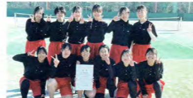
ソフトテニス女子

団体・個人ともに県大会出場、さらに県で勝つことを目標に日々努力しています。さらに、ソフトテニスを通して「自ら考え、行動できる人間」へ成長することも目標です。最高成績は、個人：県5位（東海出場）、団体：県5位（県選抜出場）です！名北地区でソフトテニスやるなら、高蔵寺高校だ！詳しくは本校HPをご覧ください。