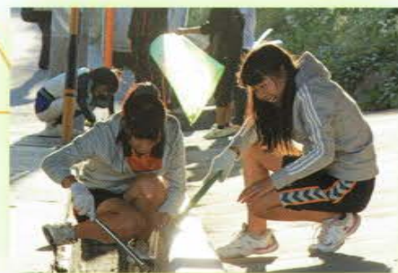
若竹クリーンプロジェクト(地域清掃)