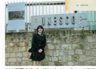
ESD国際交流プログラム(パリ ユネスコ本部前)