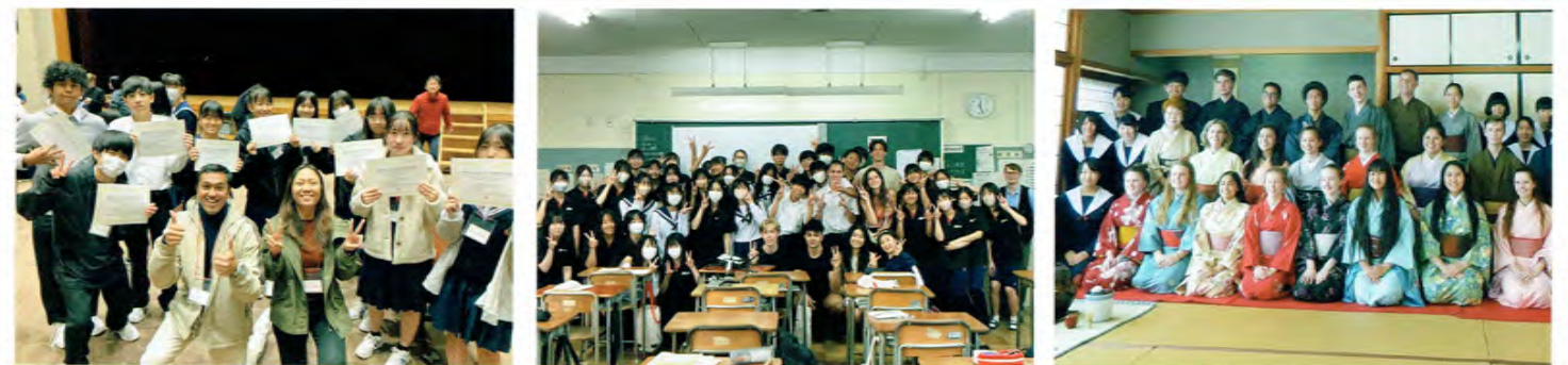
イングリッシュキャンプでは3日間英語づけ