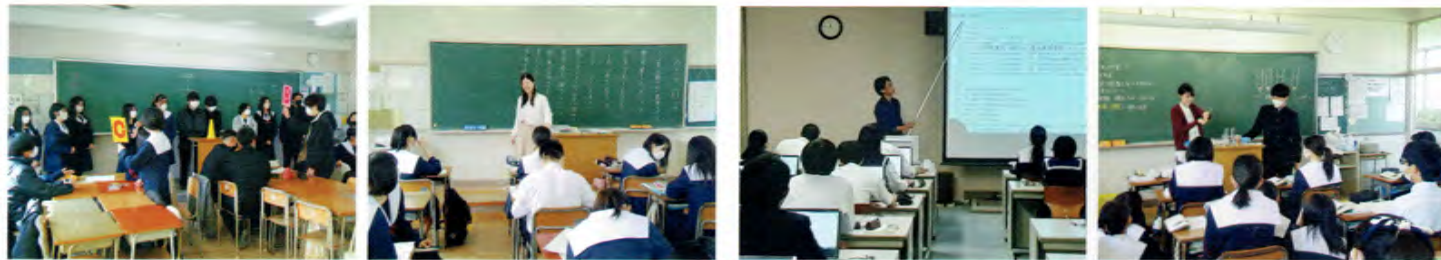
生徒主体で進む英語の授業中 古文のなかの体言と用言を考えている生徒たち パソコンルームでHTML言語を学習中 酵素の反応を見る実験中。リアルな体験が本物の知識に

文系 教えこむ授業ではなく、生徒が考える授業を展開 理系 日常生活に使える、生きた理系教育を実現