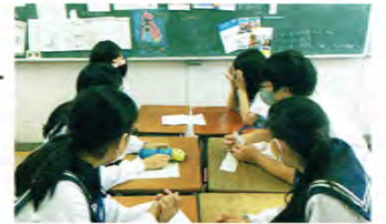
先進的な英語教育を推進

ネイティブの講師陣の授業が受けられるうえ、留学生を常に受け入れているため、生きた国際交流を日常的に体験できます。