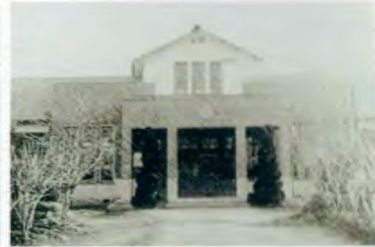
古知野町立古知野高等実践女学校