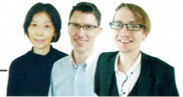
私たちが教えます!

2泊3日のイングリッシュキャンプ、中学校への出前授業、JICA訪問、留学生との交流など、独自の行事が盛りだくさん!