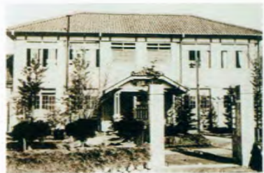
愛知県丹羽郡高等女学校