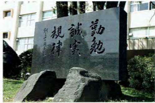
尾北の本館前庭にある校訓碑

自由で伸び伸びとした尾北高校の校風。その根幹をなすものが、この校訓です。生徒一人ひとりに宿る、自分の目標に向かって勉強を頑張ろうとする「勤勉」さ、他者に対して「誠実」であろうとする姿勢と「規律」を重んじる心が、現在の明るく穏やかな尾北高校を作っているのです。