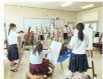
授業風景(デッサン)