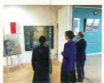
高大連携出張授業