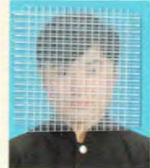
秋田公立美術大学 美術学部美術学科