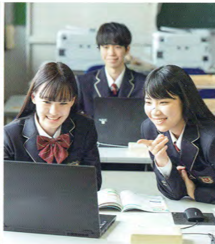
【教育課程表】令和6年度入学生