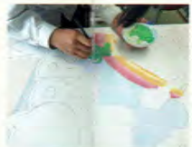
授業風景(デザイン)