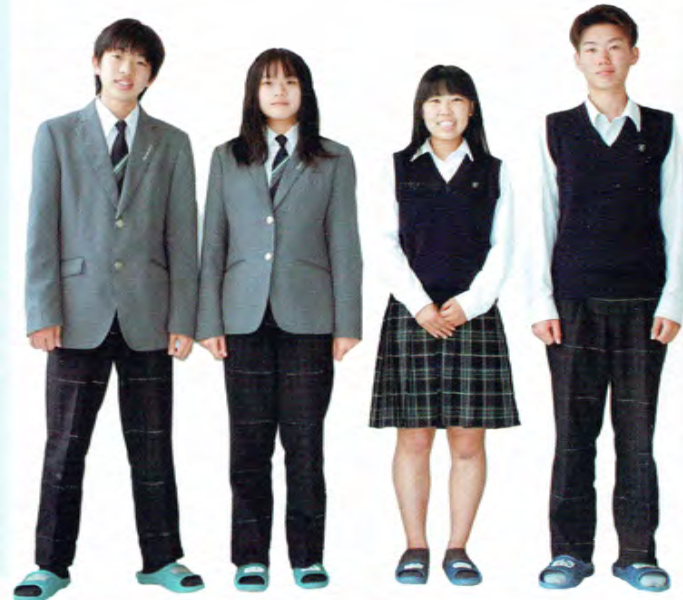
★令和3年度より新制服になりました★