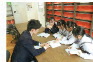
進路相談室での学習指導

本校には、多くの卒業生を進路目標の実現に導いた豊富な経験が蓄積されています。その経験をもとに生徒たちに的確な助言を行い、一般選抜に限らず総合型選抜や学校推薦型選抜など、個々の生徒の適性に合わせた入試制度を活用して進路目標の実現に導いています。