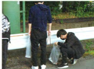
クリーンキャンペーンの様子

部活動に21:00から1時間程度参加することができます。部活動は、卓球部、バドミントン部、文化部などがあります。公式戦に出場し日々練習した成果を発揮することもできます。