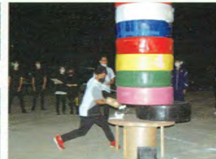
体育祭でのだるま落とし