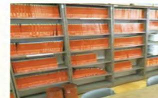
貸出可能な豊富な赤本

本校には、多くの卒業生を進路目標の実現に導いた豊富な経験が蓄積されています。その経験をもとに生徒たちに的確な助言を行い、一般選抜に限らず総合型選抜や学校推薦型選抜など、個々の生徒の適性に合わせた入試制度を活用して進路目標の実現に導いています。