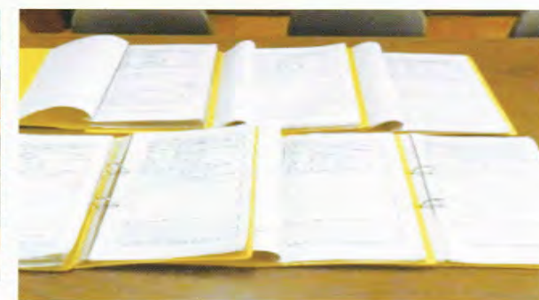
卒業生が残した豊富な記録