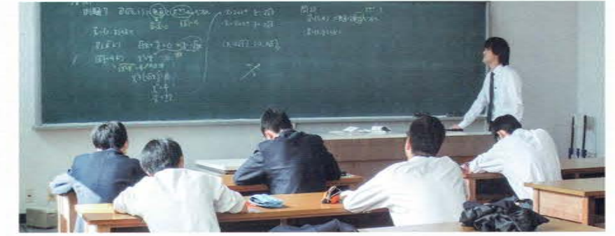
少人数による習熟度別学習