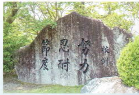
愛知県立松平高等学校 校訓