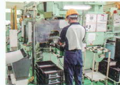
インターンシップ