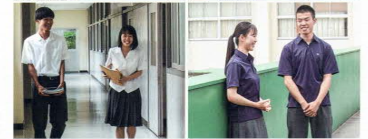
女子スラックスを導入しています。制服は気候に合わせて、色々な組み合わせで着ることができます。