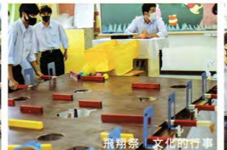
飛翔祭 | 文化的行事