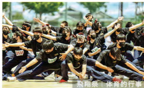
飛翔祭 | 体育的行事