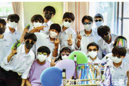
飛翔祭 | 文化的行事