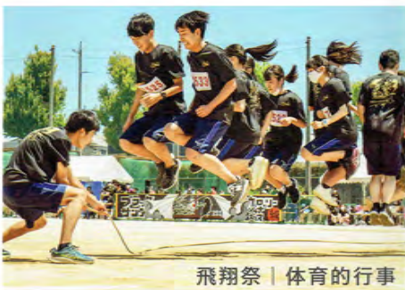
飛翔祭 | 体育的行事