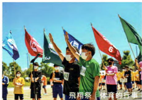
飛翔祭 | 体育的行事